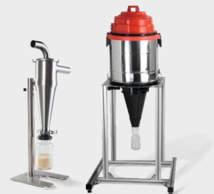
高性能旋风分离器和 FRITSCH 旋风分离器

结果： 以最小的热负荷达到高通量且快速有效的粉碎，同时无需清洗即可达到无交叉污染。