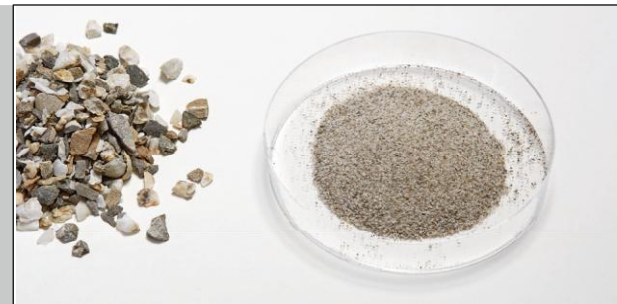
使用交叉搅拌研磨机 PULVERISSETTE 16 研磨石头之前和之后的状态