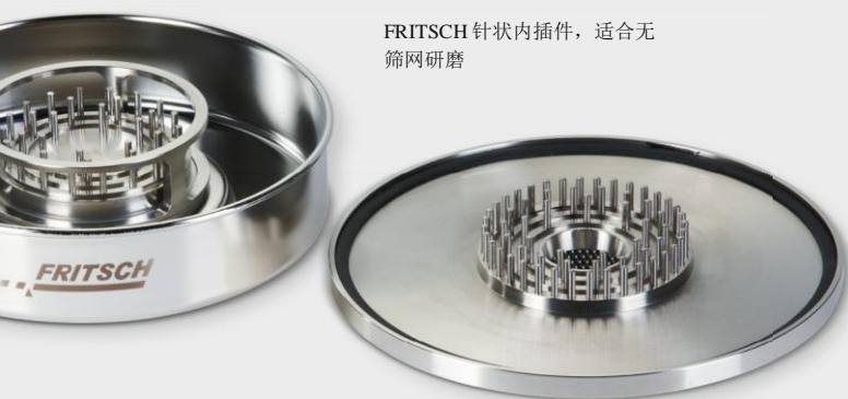
FRITSCH 针状内插件，适合无筛网研磨

另一个建议： 在研磨热敏型样品时，为大批量研磨配备的带有大尼龙支架的转换套件可确保高空气流通量，达到更好的冷却效果。