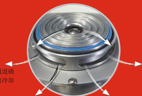
独特的气流通道确保样品的有效冷却

FRITSCH 产品特有：PULVERISETTE 14 经典型巧妙的空气流通通道确保有持续的气流对转子、电机组件以及收集盘中的样品进行冷却。同时，大的排气风扇通过滤网将冷空气吹进仪器内，从而产生正向气压，避免环境空气中的粉尘进入仪器。