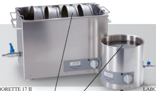
LABORETTE 17 II 型尺寸