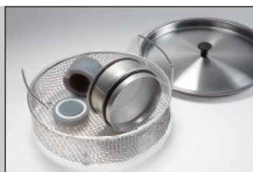
LABORETTE 17 I 型尺寸

LABORETTE 17 II 型尺寸操作简单: 清洗筛网时, 将其放置在清洗液中简单地清洗。