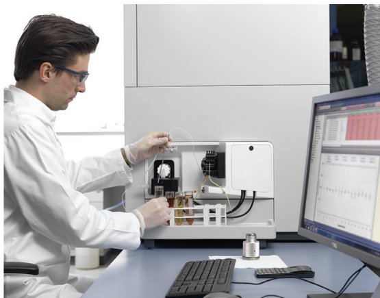
图1. 最为方便、简洁的操作设计、最短管路减小记忆效应、最快的完成样品分析的iCAP Q ICPMS进样系统。

iCAP Q ICPMS可达到大于9个量级的动态线性范围，此方法中依据样品中待测的有害金属元素含量，将标准溶液配置成0至100ng/mL，各个元素相关系数均大于0.999。（图2）