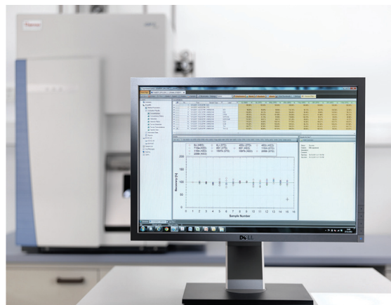
图2. iCAP Q ICPMS的Qtetra软件，拥有独一无二的表格式分析结果显示，简单直观，实时更新分析数据，可监控内标变化和质控样，结果可多格式方式导出(Excel, PDF等)，无需数据转换软件，并可个性化定制输出报告。